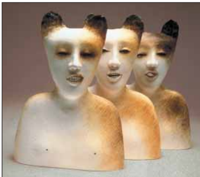
Na snímku objekt z kameniny nazvaný Rozhovor (velikost 40x38 cm)

Autorka se pohybuje na české i mezinárodní výtvarné scéně již 40 let, a přestože je známa především jako tvůrkyně keramiky, neomezuje se při své tvorbě jen na tento materiál a ve svých uměleckých myšlenkách a vizích používá stále nové techniky. Vernisáž v 18 hodin.