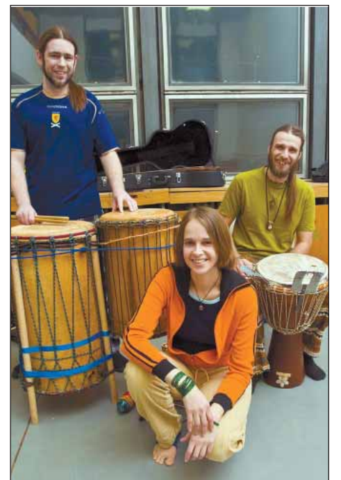
Charakteristickou složkou africké hudby jsou nejrůznější typy bubnů.

„Prostřednictvím příběhu dětem nebo mládeži přibližujeme život v Africe, nebo se je snažíme přimět ke kreativě. Využíváme k tomu spoustu rekvizit a hudebních nástrojů. Pokud jde o seniory, tak těm by tyto programy měly pomoci najít ztracenou sebedůvěru, obnovit pocit důležitosti a rovněž by měly sloužit k procvičování paměti a motoriky,“ doplňuje Marcela Sovadinová. (peb)