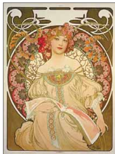
Alfons Mucha, Snění, 1897, barevná litografie. Z výstavy v GVOU.

GVUO, Jurečkova 9, Ostrava 1 Tel.: 596 112 566, www.gvuostrava.cz