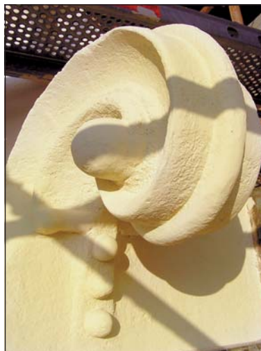
Detail opraveného stavebního prvku.

V domě na Nádražní 45 bude provedena výměna všech oken v bytových i ve společných prostorách, po které budou následovat malířské a klempířské práce (včetně nátěrů), oprava fasády z uliční strany (včetně sjednocujícího nátěru), doplnění fasády z dvorní části keramickým obkladem atd. (peb)