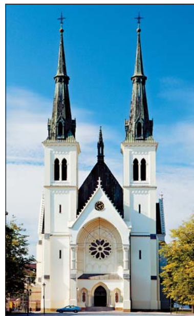
Kostelu na nám. Sv. Čecha je 111 let.

společnosti Ekofas Roman Beránek. Obnova kostela, který navrhl věhlasný architekt Camillo Sitte a 15. srpna uběhlo 111 let od jeho posvěcení, byla realizována v rámci Operačního programu přeshraniční spolupráce Česká republika–Polská republika 2007–2013, v oblasti zaměřené na podporu přeshraničního cestovního ruchu. (peb)