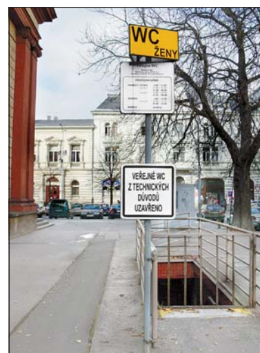
Veřejné WC na náměstí Msgr. Šrámka je již minulostí.

Jde o to zjistit, za jakých technických podmínek by bylo možno vybudovat tuto trasu, která by vedla po levém břehu Ostravice pod mostem B. Němcové, dále pak pod haldou a podél areálu bývalého Dolu Odry. Tam by se mohlo využít nově postaveného dálničního přemostění a pod ním by trasa šla po pravém břehu Odry k nedalekému zdymadlu. (rd)