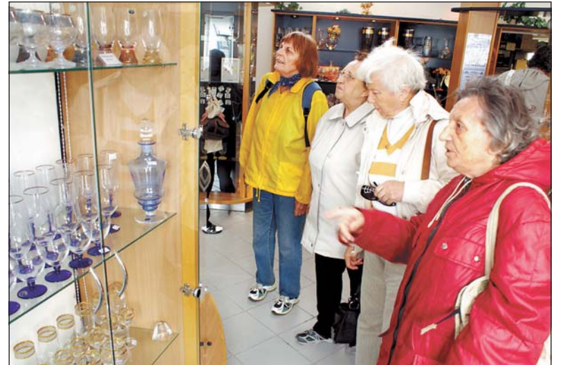
Ve sklárně Karolinka bylo co obdivovat, slovy chvály nešetřily hlavně ženy.

Ve středu 16. června se uskutečnil zájezd seniorů z Moravské Ostravy a Přívozu do beskydských sklárů v Karolince. Zúčastnilo se ho celkem třicet osm osob. Všichni byli s akcí, kterou pravidelně organizuje ÚMOB Moravská Ostrava a Přívoz, odbor sociálních věcí – oddělení péče o občany, spokojeni.