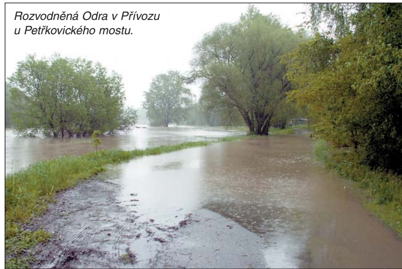
Rozvodněná Odra v Přívozu u Petřkovického mostu.

vodu z Husova sadu, Komenského sadů a ze Sadu Dr. Milady Horákové. Technické služby během celé kalamičty čistily upaně a nefunkční kanalizační vpusti a odstraňovaly spadlé větve na komunikacích. (inf)