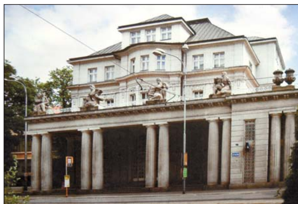
Sochy a vázy na průčelí bývalé Krausovy vily dostanou do srpna nový kabát.