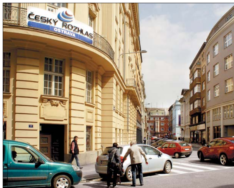
Ulice Na Hradbách začíná u Havlíčkovy nábřeží za zadním traktem městské knihovny, pokračuje kolem sídla Policie ČR, přetíná ulici Sokolskou a pak vede podél Ostravského rozhlasu k Jiráskovu náměstí. Náš pohled na ulici Na Hradbách je od budovy Českého rozhlasu směrem k Ostravici.

Hradby začínaly za kostelem sv. Václava, kde byla Kostelní brána, o kus dál byla v hradbách branka zvaná fortka, kudy procházeli pěší. Zeď pokračovala blíže k Ostravici a pak uhýbala na severozápad. Právě tento ohyb hradební zdi kopírovala cesta končící u Přívozské brány, skrze kterou vedla cesta do Přívozu. Hradby pokračovaly prostorem za Zámeckou ulicí a přibližně u dnešní Puchmajerovy ulice se ohýbaly na jih a končily v prostorách ulice 28. října (někdejší Říšské silnice), kde byla Hrabovská brána. Od ní pokračovala