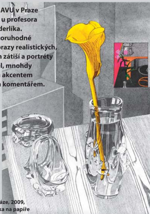
Žlutá kala ve váze, 2009, 49x36 cm, tužka na papíře

Absolvoval AVU v Praze v roce 1985 u profesora Arnošta Paderlíka. Vytváří pozoruhodné kreslené obrazy realistických, až bizarních zátiší a portréty svých přátel, mnohdy s barevným akcentem a s vlastním komentářem.