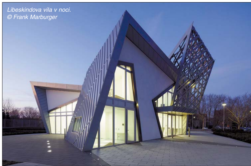
Libeskindova vila v noci.

Až do 28. 11. je možné v Galerii výtvarného umění navštívit výstavu amerického architekta, výtvarníka a scénografa Daniela Libeskinda nazvanou Architektura je řeč. Polský rodák (1946, Lodž), který je od roku 1965 americkým občanem, je jednou z největších osobností současné světové architektury a urbanismu.