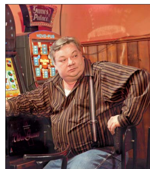
Roli zaměstnance úřadu práce ztvárnil stále populárnější Norbert Lichý.