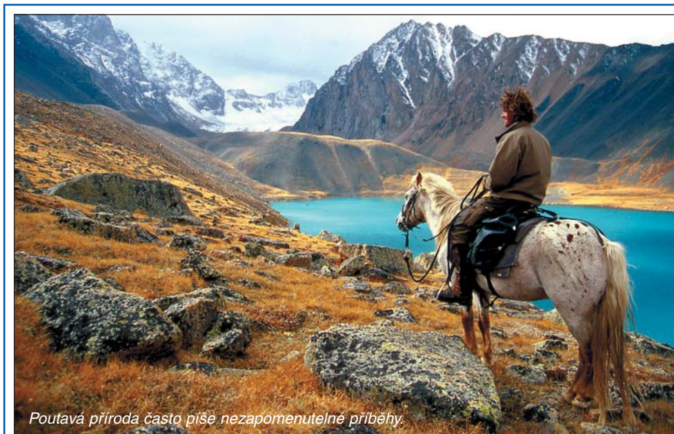
Poutavá příroda často píše nezapomenutelné příběhy.

Knihovna města Ostravy, ul. 28. října 2 Tel.: 599 522 611, www.kmo.cz