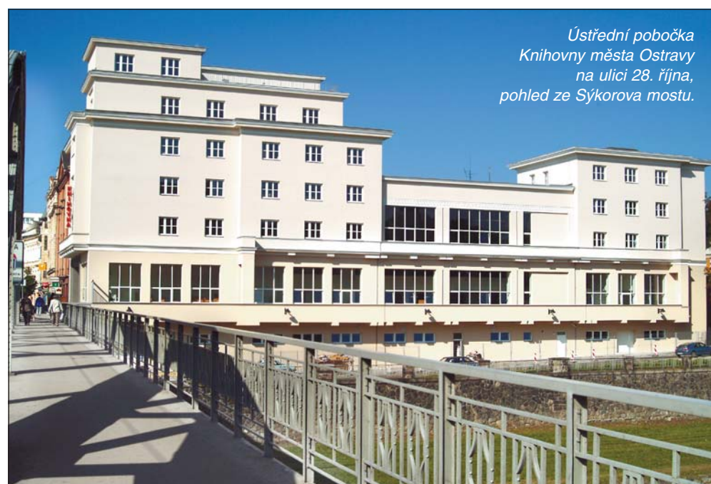
Ústřední pobočka Knihovny města Ostravy na ulici 28. října, pohled ze Sýkorova mostu.

Knihovna města Ostravy se stala Městskou knihovnou roku 2010. Soutěžilo 38 městských knihoven z celé České republiky. Sedmdesátitisícová odměna za vítězství má být použita na pořízení e-booků – čtečky elektronických knih.