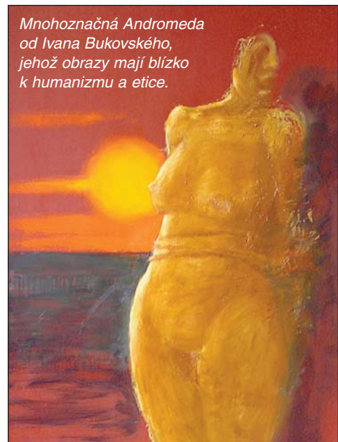
Mnohoznačná Andromeda od Ivana Bukovského, jehož obrazy mají blízko k humanizmu a etice.

Do 6. 8.: Ivan Bukovský – Útržky příběhů. Obrazy Ivana Bukovského (1949) hledají inspiraci v biblických tématech a starověké mytologii.