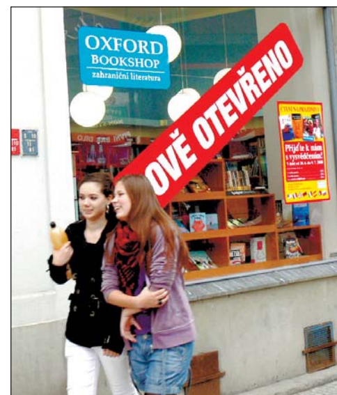
Kuří rynek (Jiráskovo náměstí) má novou prodejnu anglicky psaných knih – Oxford Bookshop, která byla otevřena 16. června. Předpokládá se, že největší zájem o knihy budou mít studenti Ostravské univerzity a cizinci, kteří z pracovních důvodů zvolili náš městský obvod jako své trvalé bydliště.

Knihkupectví Academia bylo v Ostravě otevřeno v roce 2003. Literární kavárna tohoto knihkupectví se stala vyhledávaným místem autorských čtení, knižních křtů a setkávání uměleckých osobností.