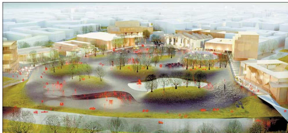
Vítězný návrh nizozemského studia Maxwan: koncertní síň, výstavní síň, centrum moderní hudby a školní budovy budou rozestavěny kolem centrální parkové části.

Tyto stavby jsou v návrhu rozestavěny do jákehoosi půlkruhu, který může připomínat wester-