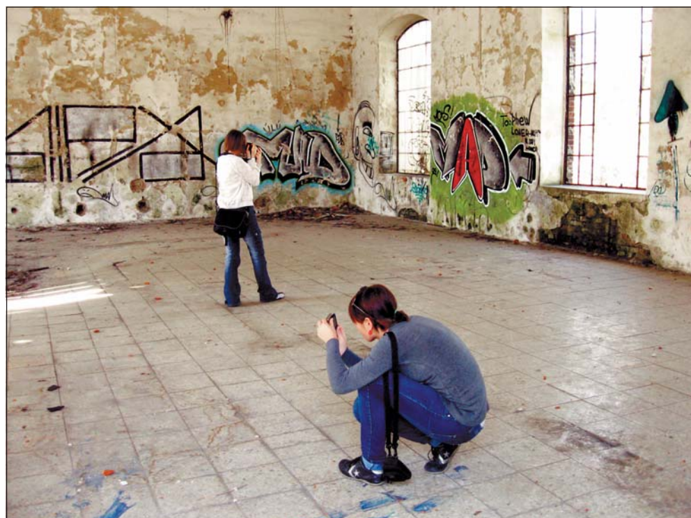
Galerie Magna, projekt Dva regiony na hranici: I zdánlivě opuštěný prostor může mít své kouzlo. Jen je nutné otevřít oči...

Každopádně v roce 2009 AMO převzal 83,70 metrů archiválií. Při podrobnějším zkoumání zjistíme, že necelých 84 metrů archiválií můžeme dále rozdělit na 13 úředních knih, 2 indexy, 2 alba fotografií a 774 archivních kartónů spisů. Jde o to, že v současnosti AMO přijímá především aktový materiál. Ten tvoří podstatnou část úřední produkce úřadů. (peb)