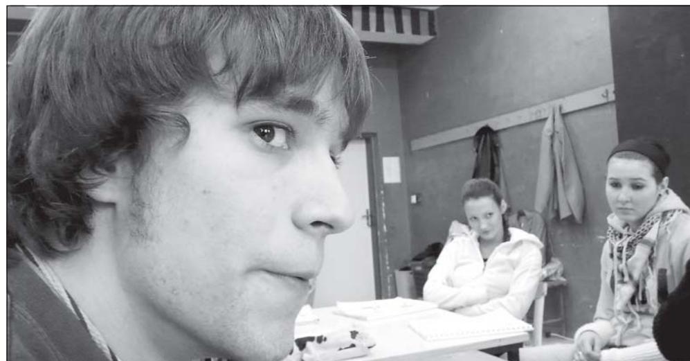
Vzhledem k tomu, že pověstné kouzlo Stodolní ulice ještě zdaleka nevyprchalo, dá se předpokládat, že o muzikál bude mezi širokou veřejností permanentní zájem.

zahrnovala například zajištění patřičných výstavních podmínek (18° C teplota, 55% vlhkost a osvětlení max. 120 luxů).