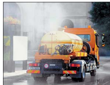
Kropicí vůz z kvalitní ovzduší pro obyvatele centra i jeho návštěvníky.

Pořízení kropicího vozu stálo 2 278 tisíc Kč. Městský obvod přispěl milionem sedm set tisíc korun, zbytek uhradily Technické služby MOaP.