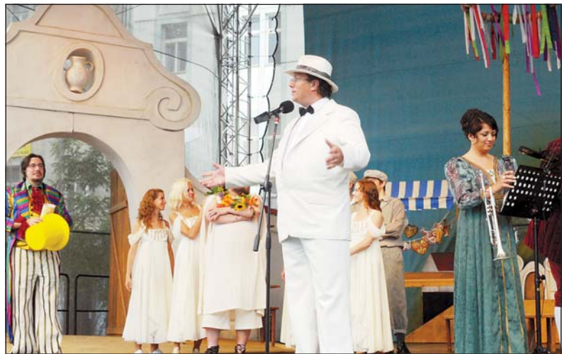
Pódium na Masarykově náměstí 28. srpna večer.

Oslavy Národního divadla moravskoslezského. – Před devadesáti lety, 12. srpna 1919, uvedlo Národní divadlo moravskoslezské v budově dnešního Divadla Antonína Dvořáka Smetanovu operu Prodaná nevěsta. Šlo o zahajovací představení nové české divadelní scény. Předtím (7. a 8. srpna 1919) proběhly divadelní slavnosti.