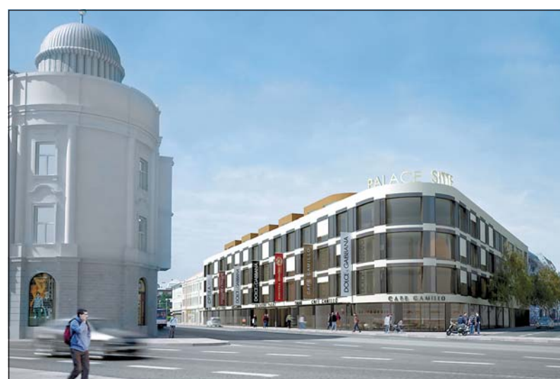
Vizualizace nového objektu na nároží ulic Nádražní a Macharova.