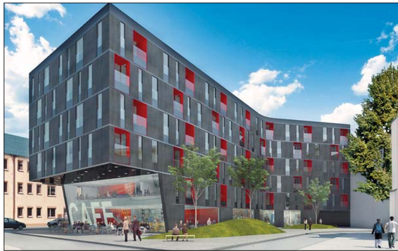
Tak má vypadat nový objekt na Kostelním náměstí Městská brána.

Kde hledat důvody skutečnosti, že zatímco jiné stavební projekty zůstaly jen na papíře, tak Městská brána se nadále staví? „Kdo nezačal stavět před krizí, dnes nestaví. A kdo začal a dnes nestaví? Souvisí to určitě s propadem poptávky. V Ostravě na-