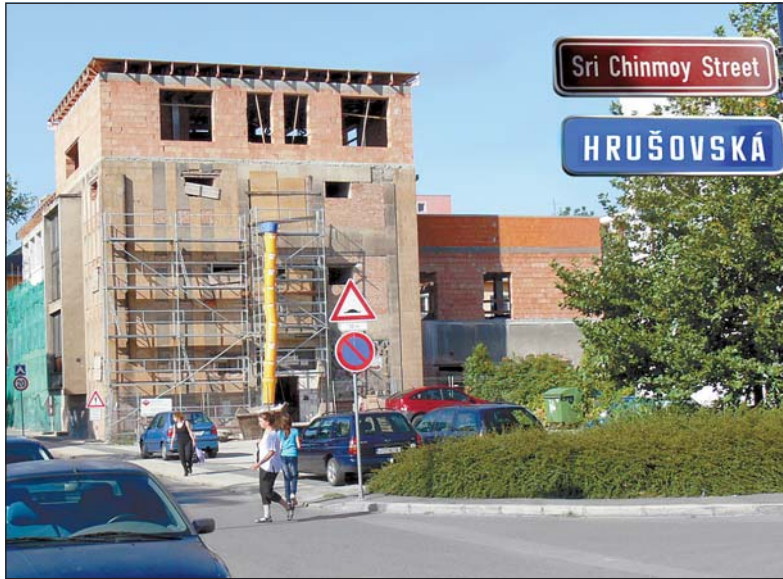
Hrušovská ulice má i ekvivalentní název v angličtině Sri Chinmoy Street. Umístění této tabulky je zřejmě oficiální. Na snímku je budova bývalého kulturního domu (Hrušovská 16), která je v přestavbě.

Proč byla původní myšlenka opuštěna? Individuální výstavba byla potlačována, prioritou byla, jak známo, sídliště v Porubě a Jižním městě. Dnes je však situace jiná a pozemky, které zabírá vozovna i část nedostatečně udržovaných sportovišť, jsou perspektivní zálohou pro vilovou zástavbu městského typu. Jejich hodno-