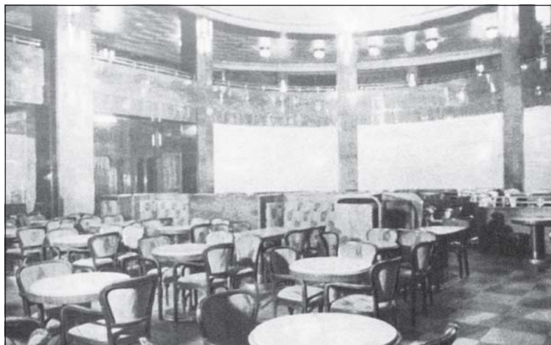
Kavárna bývalého hotelu Palace byla ještě dlouho po druhé světové válce prestižním restauračním zařízením. Po roce 1990 byla přeměněna na bankovní prostory a v posledních letech zeje prázdnou. Snímek z roku 1934.