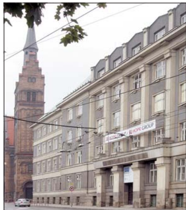
Budova bývalé Revírní bratrské pokladny na Českobratrské ulici 18 patří k architektonicky nejcenějším objektům v Ostravě.

V budově, která se skládá ze tří částí, měla až do konce 2. světové války sídlo Revírní bratrská pokladna. (ra)