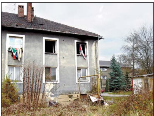
V tomto domě (Jílová 35), jehož majitel je v konkurzu, dochází k trvalé devastaci.

Po 11. hodině se místostarosta přemístil na Nádražní 195, kde sídlí odbor bytového hospodářství, oddělení správy a údržby domovního a bytového fondu. Zde proběhla jednání se zaměstnanci tohoto odboru.