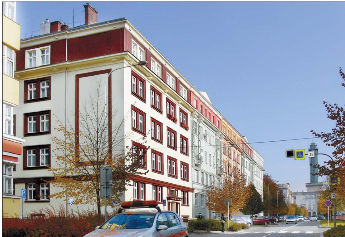
Ulice 30. dubna, jejíž zakončením je Prokešovo náměstí s radniční věží, patří k nejprezentativnějším v celé Ostravě. Bytové domy postavené v meziválečné době působí svěžím barevným dojmem.