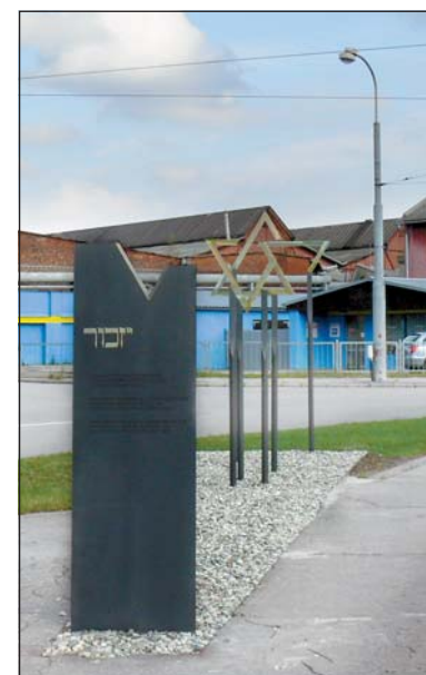
Památník připomínající 70. výročí transportu Židů z Ostravy se nachází v bezprostřední blízkosti budovy České pošty u nádraží v Přívozu.