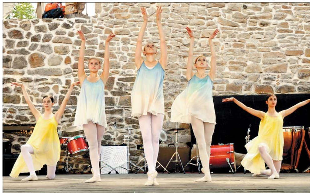
Konzervatoristé na Slezskoostravském hradě. Letos tam vystupovali už počtvrté. Hráli, zpívali a tancovali, patřil jim celý den.

Program festivalu na: www.filmfestivalostrava.com