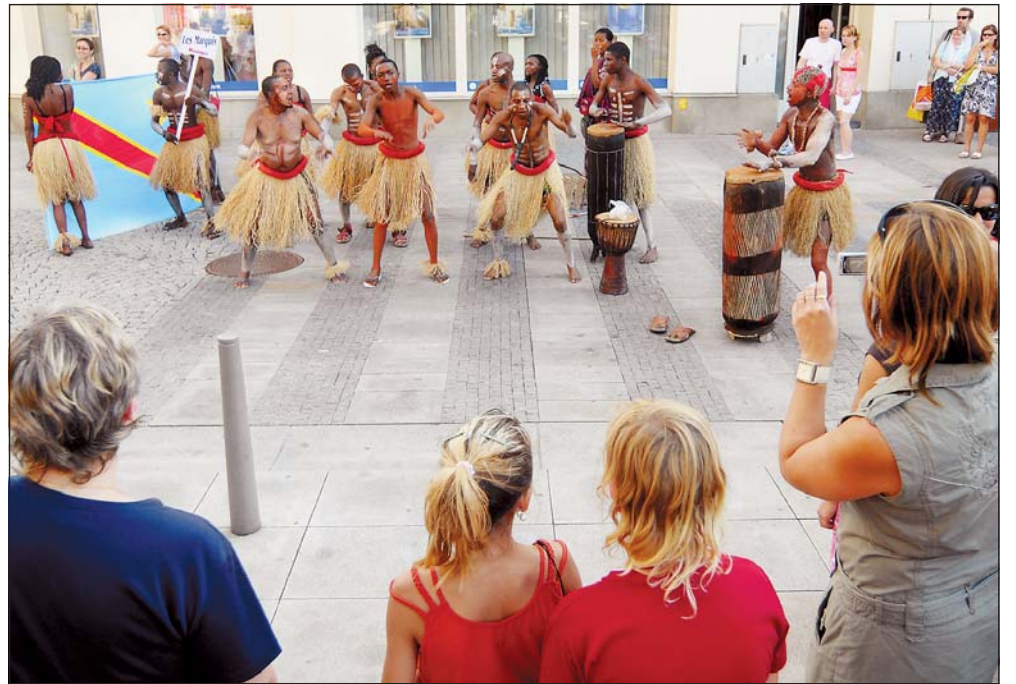
Afričtí tanečníci v sukničích z trávy na pěší zóně. Takový pohled se naskytl občanům Ostravy při průvodu městem.

DKMO, 28. října 127, Moravská Ostrava Tel.: 597 489 111, www.dkmoas.cz