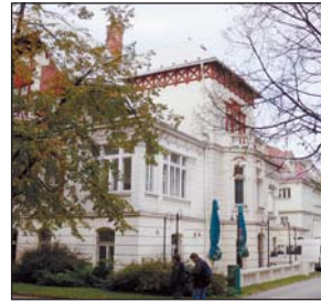
Ulrichova vila, kde nyní sídlí klub Parník.