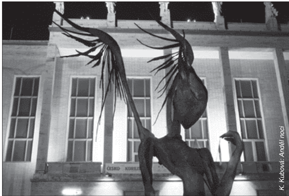
K. Kubová: Anděl noci