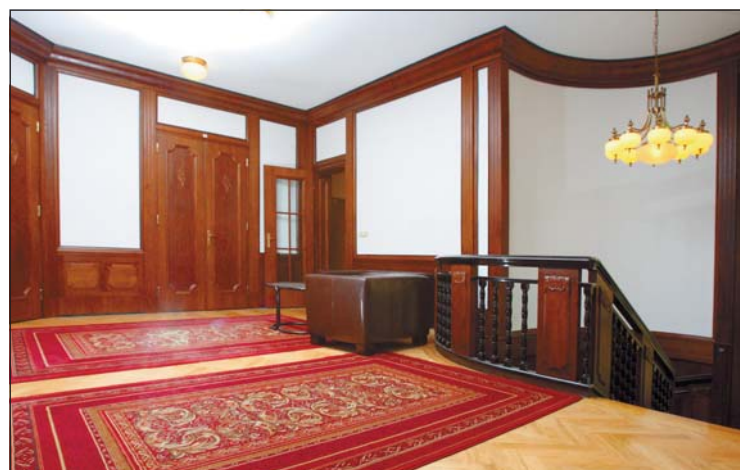
Dobový interiér budovy Českého rozhlasu Ostrava po rekonstrukci.

Vlastní vysílání představovalo na počátku tři hodiny, další program se přebíral z Prahy a Brna. Vše se vysílalo živě, natáčení tehdy ještě neexistovalo. Do pořadů z Ostravy se postupně zařazovaly přímé přenosy z kaváren, divadla a z jiných míst. Nacisté v závěru války zničili vysílač