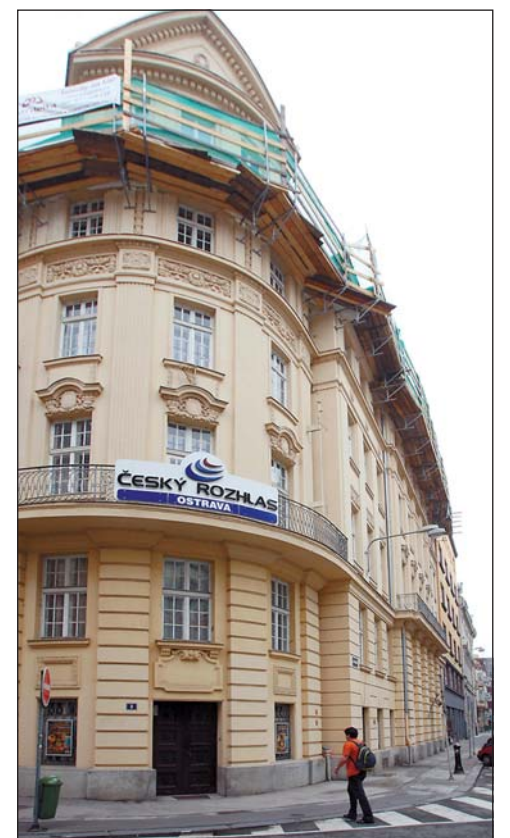
Klasicistní čtyřpatrová nárožní budova, v níž sídlí Český rozhlas, byla postavena v roce 1921.

V současné době vysílá Český rozhlas Ostrava denně od 5.00 do 21.00 hodin a naladit si ho můžete na frekvenci 99.0 a 107.3 MHz. (pb)