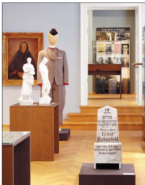
Záběr z nové expozice Ostravského muzea.

Pro různé věkové skupiny budou zpracovány zajímavé doplňovací programy a pro školní mládež výukové hodiny v expozicích. Také některé krátkodobé výstavy doplníme přednáškami, workshopy a interaktivními prvky. (Ik)