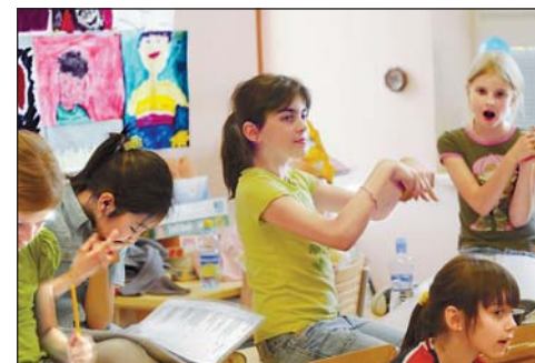
Malí herci zvládají náročné texty i zpěv.

Na přípravě muzikálu se za dohledu a spolupráce profesionálů podílí všech 90 žáků prvního až pátého ročníku bilingvních (dvojazyčných) tříd. Nejde jen o hudební interpretaci a zpěv či choreografii, ale žáci také sami vyrábějí rekvizity, pomáhají při šití kostýmů, připravě scény, prošli výtvarnou soutěží, jak nejlépe vystihnout příběh na pozvánkách a plakátech.