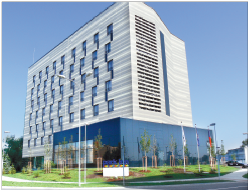
Hotel Park Inn na Hornopolní ulici v Ostravě-Fifejdách už přivítal první hosty. Jeho součástí je i konferenční centrum s prostory vhodnými pro zasedání, firemní akce i soukromé bankety. Budoucí velkou výhodou hotelu oproti konkurenci je jeho poloha blízko plánovaného dálničního přivaděče na D47.