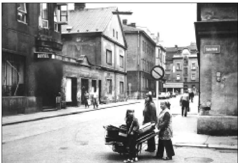
Hotel Odra a Stodolní ulice v roce 1960. Centrum třetího největšího města Československé socialistické republiky.