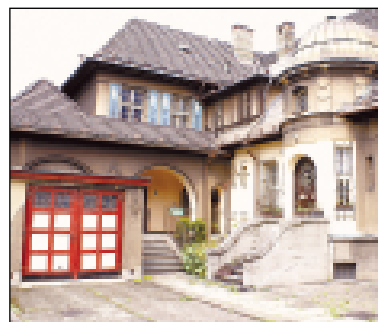
Nádvoří Grossmanovy vily.

Vilu v ulici Na Zapadlém čp. 1674 v Moravské Ostravě získá darem hejtmanství Moravskoslezského kraje jako reprezentační sídlo.