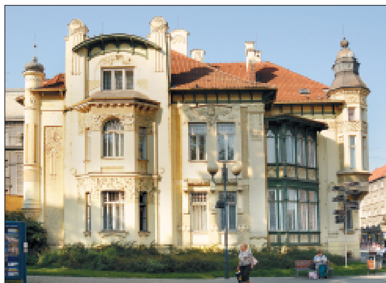
Vila z roku 1903 na Českoobrabské ulici v Moravské Ostravě.

50 slavných vil Moravskoslezského kraje postavených v posledních dvou stoletích představuje výstava (ale i stejnojmenná publikace) v Domě umění na Jurečkově ulici, a to až do 8. listopadu. (ad)