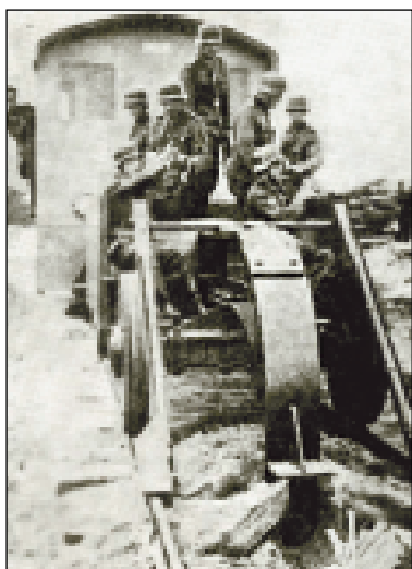
Vojenská jednotka s destruktčním pluhem, který vytrhával z drážního tělesa pražce.