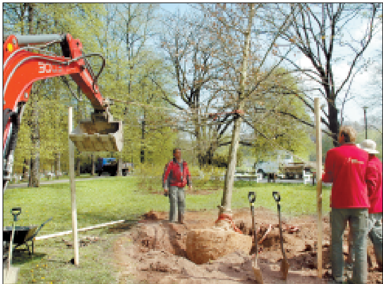
Taříka dvě tuny vážil dub, který byl vysazen v Komenského sadech. Další informace o výsadbě stromů v našem obvodu najdete na straně 2.