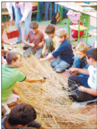
Součástí výuky je i práce s obilím.

Základní školy v našem obvodu mají jména podle ulic, v nichž se nacházejí: ZŠ Nádražní, ZŠ Gajdošova, ZŠ Zelená, atd. Základní škola waldorfská, která sídlí na ulici Generála Píky v Mor. Ostravě-Fifejchách má své jméno podle místa, kde v roce 1919 založil Rudolf Steiner nový typ školského zařízení.