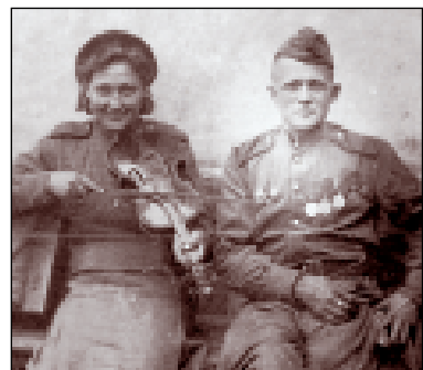
30. duben 1945 v Ostravě.

Sýkora, ale německá trafikantka Ilša zachránila most. Údajně přestříhla dráty nůzkami. To je vysoce nepravděpodobné, protože dráty byly přerušeny ve spodní části mostu. Jak by se tam ta ctihodná dáma dostala?