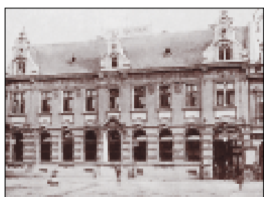
Hotel National – původní podoba.

Společnost NBC už také požádala, aby jí byly pronajaty přilehlé městské pozemky. Potřebuje totiž, aby se ke komplexu dostali stavební dělníci a mohli demolovat parovod, vodovodní a kanalizační přípojky a další inženýrské sítě. Zřejmě jí bude vyhověno.