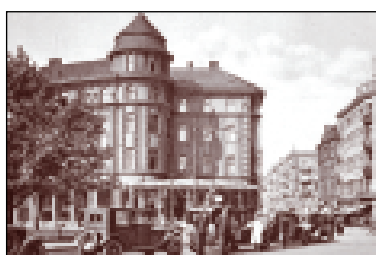
Nejcennější částí byla Aufrichtova kavárna Evropa na Smetanově náměstí.