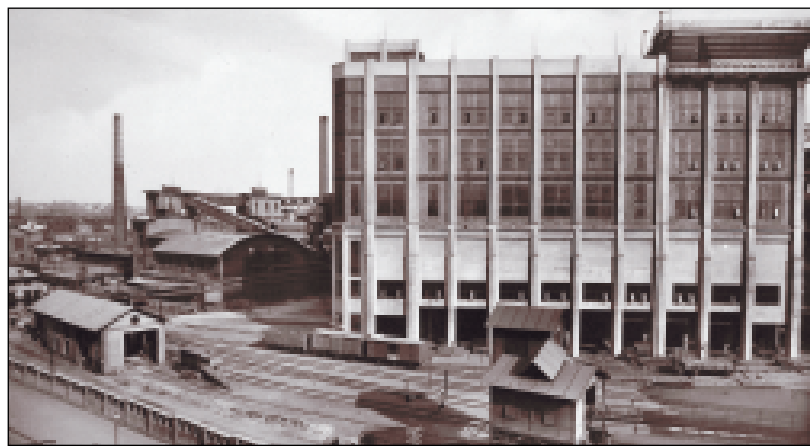
Ve třicátých letech minulého století byla na Karolině postavena vysoká funkcionalistická budova uhelného prádla, ač měla značnou architektonickou hodnotu, byla v roce 1989 odstřelena.

Žofinská huť byla uzavřena v roce 1972 a elektrárna v roce 1974, ale ještě pak nějaký čas sloužila jako teplárna pro město. Uvnitř areálu postupem času vznikl chemický provoz Ostravit, který ač vyráběl mnoho produktů, dostal jméno podle vynikající bezpečnosti důlní trhaviny. K tomu jen tolik, že zmíněné Dvojhalí, unikátní kousek průmyslové secese, nikdy nepatřilo ke Karolině, ale bylo jako elektrocentrála vybudovaná ještě před první světovou válkou, vždy součástí Žofinské hutě. (na)