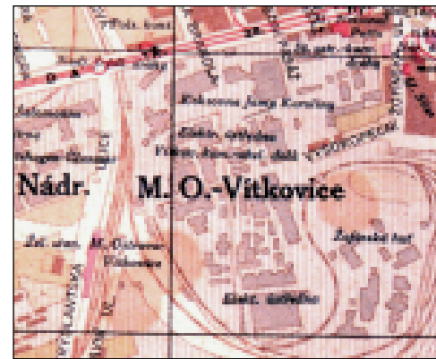
Reprodukce mapy oblasti Karoliny z meziválečného období.

V roce 1870 byla Karolina spolu s koksovnu a doly Antonín a Šalamoun pronajata na čtvrt století Uhelné a koksárenské společnosti v Moravské Ostravě. Po uplynutí této doby, tedy v roce 1895, byly doly Karolina a Antonín přičleněny pod důl Šalamoun, a to byl vlastně začátek konce Dolu Karolina, který se tak stal jen pomoc-