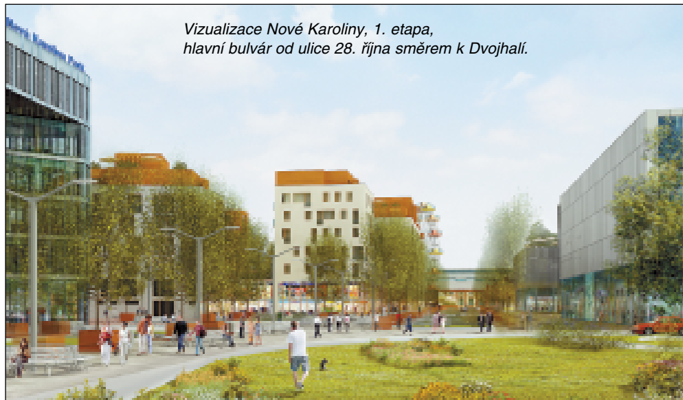
Vizualizace Nové Karoliny, 1. etapa, hlavní bulvár od ulice 28. října směrem k Dvojhalí.

Ostrava je po Praze druhým nejdynamičtěji se rozvíjícím městem republiky. Nejnovějším důkazem je zahájení výstavby nového městského centra Karolina, většího než sedm Václavských náměstí. Po slavnostním zahájení 6. června začaly úvodní práce: budování inženýrských sítí, infrastruktury a přemísťování zeminy.