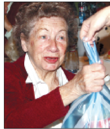
Naši jubilanti oceňují nejen dárky, ale hlavně zájem.

Všechny fotografie ze setkání najdete na www.moap.cz