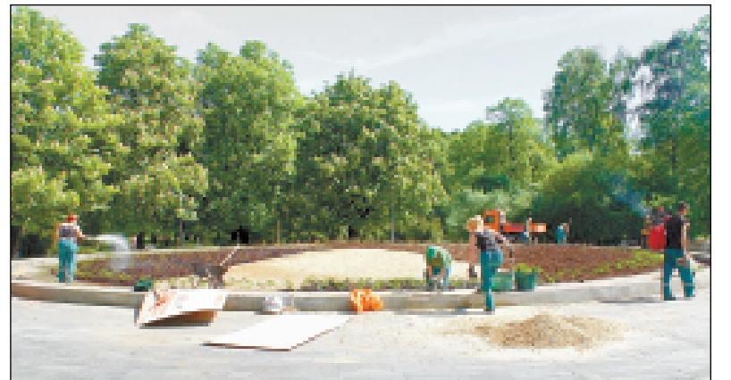
V průměru 22 metrů měla tato bývalá kašna. V současnosti se stává největším zahradnickým prvkem tohoto typu v ČR, skutečným megakvětináčem.