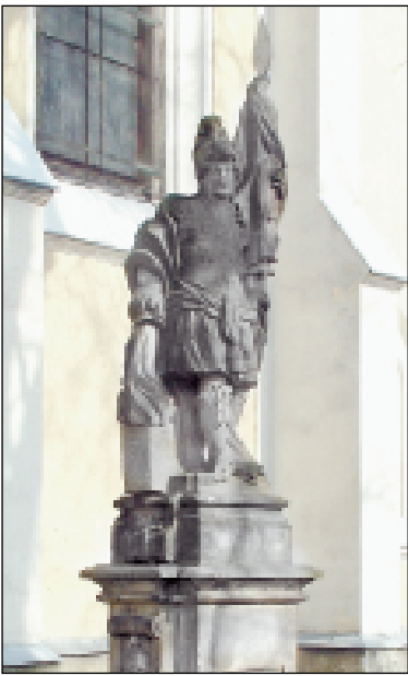
Desítky let byl sv. Florián u kostela v Hrabůvce, od 4. května stojí na Masarykově náměstí.