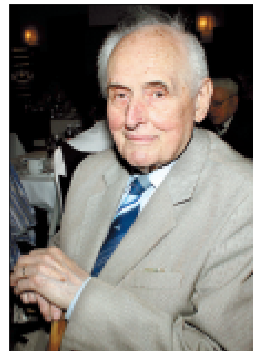
Operní pěvec Lubomír Procházka procestoval se svým povoláním velkou část Evropy, vystupoval také v Národním divadle v Praze.