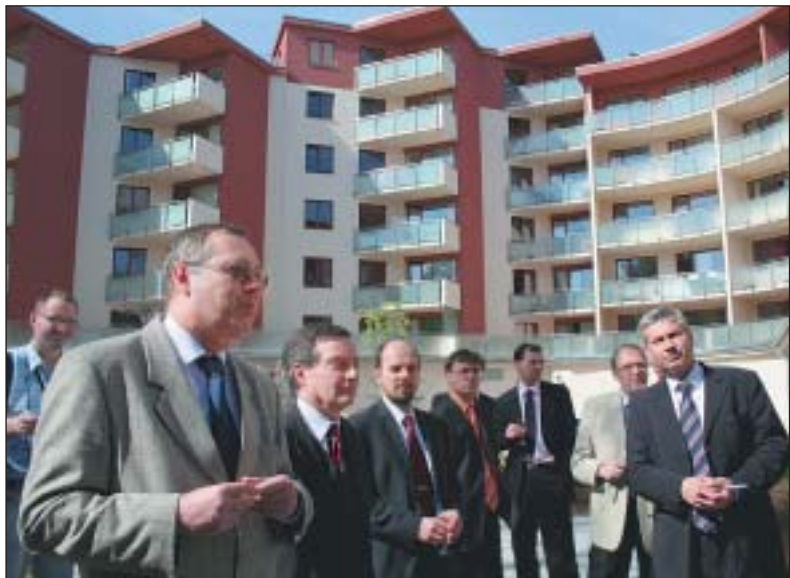
Slavnostní zahájení: zleva starosta Moravské Ostravy a Přívozu Miroslav Svozil, vedle něho i místostarosta Tomáš Kuřec. Zcela vpravo ostravský primátor Petr Kainar, vedle něho další místostarosta naší městské části Jiří Havlíček.