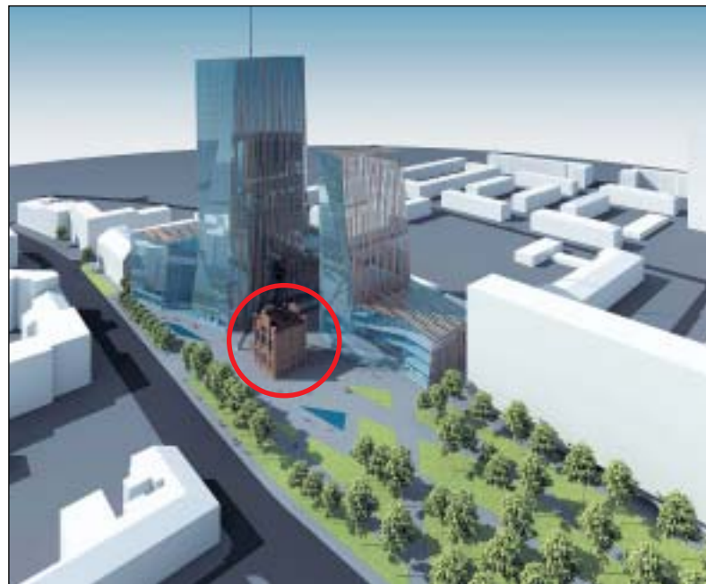
Vizualizace projektu Jindřich Plaza: centrum města dostane novou dominantu. V barevném kruhu stávající těžní věž Dolu Jindřich.

Kdybychom narazili na cokoli riskantního, nikdy bychom takovou budovu ani nenavrhovali a nejednali o jejím schválení. Od začátku při plánování a vývoji spolupracujeme s Báňským úřadem a dalšími pří-