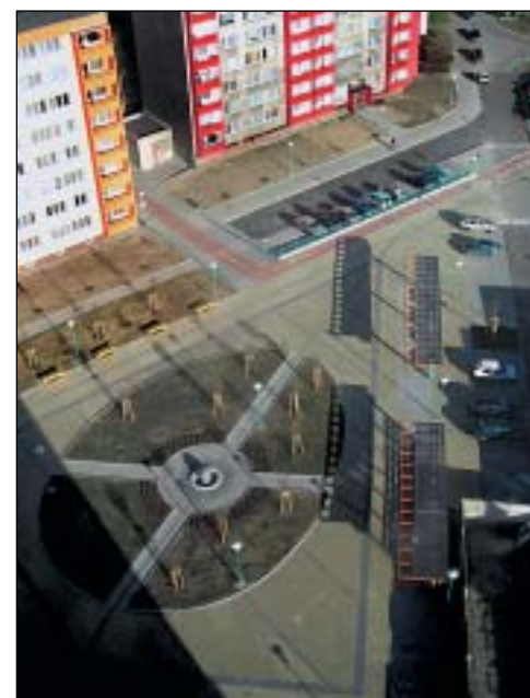
Centrum sídlíště Varenská je zatím bezejmenné náměstí s fontánkou v podobě koule z leštěné žuly.

Na sídlíšti Varenská se začínalo v roce 2003 s výstavbou dětských hřišť, postupně se dostávalo na chodníky, parkovací stání, pergoly, drobnou architekturu, cyklostezky a výsadbu nové vzrostlé zeleně. Ke kácení se přistoupilo po pečlivém průzkumu a jednalo se jen o nezbytné zásahy. Odstraňovaly se jen stromy přestárlé nebo černé topoly plodící zdraví škodlivé alergen. Letos by mělo přibýt také víceúčelové sportoviště pro odrostlejší děti a dospělé, další parkovací místa.