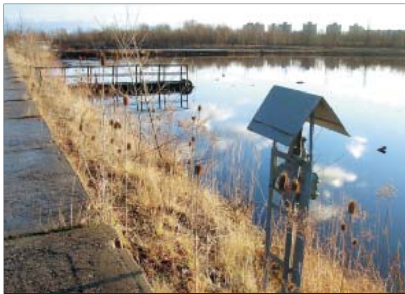
Jedna ze tří lagun je zasypaná, zbývající dvě mají otevřený povrch. V olejových derivátech často hynou i ptáci. Na horní části snímku jsou výškové budovy sídliště Fifejdy.

Děkujeme občanům sídliště Fifejdy, v části městského obvodu Moravská Ostrava a Přívoz, kteří se zúčastnili průzkumu o vnímání sanace lagun Ostramo, který připravil státní podnik DIAMO ve spolupráci s občanským sdružením VITA. Z výsledků průzkumu vyplývá, že občané se o osud lagun Ostramo zajímají a žádají přesné a soustavné informace. (po)