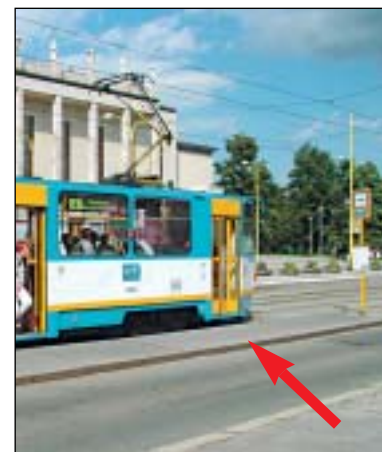
Refýž tramvajové zastávky před Domem kultury je sestavena z betonových panelů a lze ji rozebrat.

K tomu jen tolik, že právě v těchto místech mělo být – podle urbanistických plánů z šedesátých let minulého století – centrum města. Z tohoto důvodu byla asanována veškerá zastavba v okolí, odstraněn ústřední městský hřbitov, zbouráno krematorium a zlikvidován židovský hřbitov. Měly tu vyrůst obrovské společenské, kulturní a sportovní stavby.