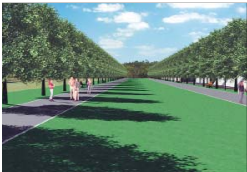
Tak vypadá vizualizace budoucí dvouřadé aleje v Komenského sadech směřem k Nové radnici. Uprostřed je plánován travnatý pás, ale konečná podoba bude ještě tématem diskuzí. V úvahu přichází také oddělená dráha pro in-line bruslaře aj.