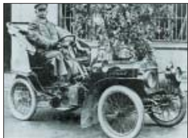
Automobil Benz Instruktor je považován za první vůz v historii, který přijel do Moravské Ostravy.