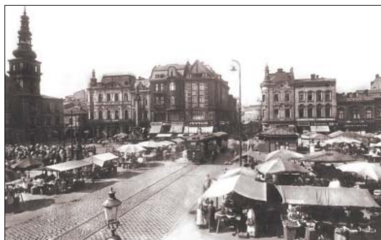
Masarykovo náměstí ve 20. letech minulého století: opravdové centrum města Ostravy.

(V minulém měsíci vyšla autorovi kniha „Ostrava“, která je premiérovou publikací ediční řady Zmizelá Morava a Slezsko. Více v příloze Kam v centru.)