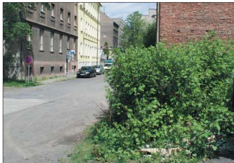
Na místě, které bylo před měsícem pokoseno, tyčí se dnes trsy Křídlatky české. Za měsíc dosáhnou trojnásobné výše.

kým postřikem, který ovšem není levný. Nicméně je tato rostlina natolik nebezpečná i pro další země, že na její ničení lze získat prostředky z ekologických fondů EU. (na)