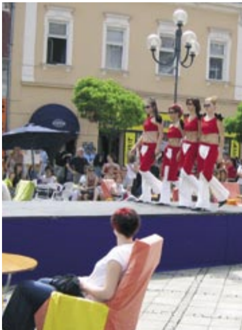
Na Kuřim rynku se bude na co dívat, ale i občerstvit se a koupit si řemeslné výrobky našich středoškoláků.