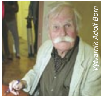
Výtvarník Adolf Born

Ostravské muzeum, Masarykovo náměstí 1, Moravská Ostrava, tel.: 596 123 760, www.ostrmuz.cz