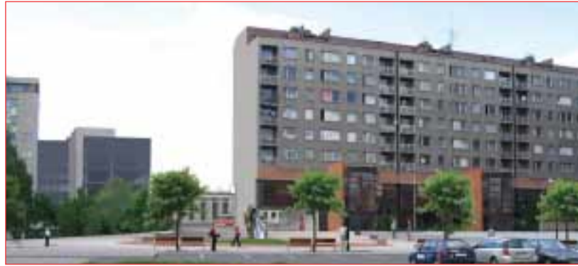
Na snímcích: současný stav vstupního prostoru do sídliště a předpokládaný stav po navrhovaných úpravách.