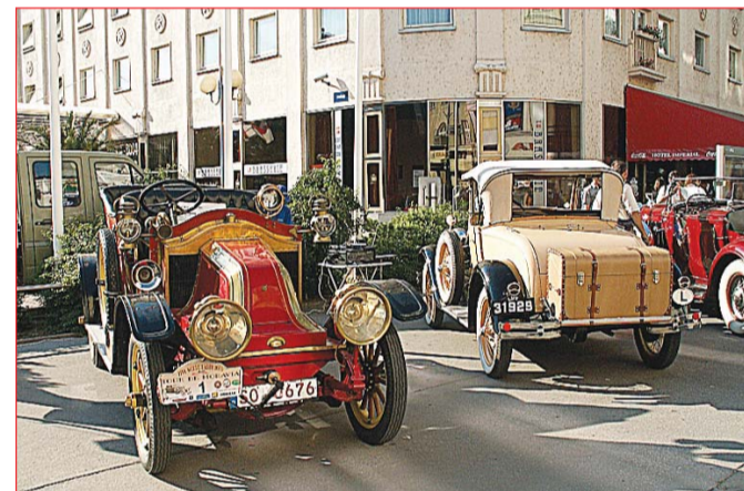
ka si prohlédnout skutečné automobilové skvosty. Nejstarší účastnické vozidlo bylo vyrobeno v roce 1905 – Renault XB Torpedo 15 CV. Závodu se zúčastnilo 55 posádek z mnoha zemí, dojel i účastník z Japonska.