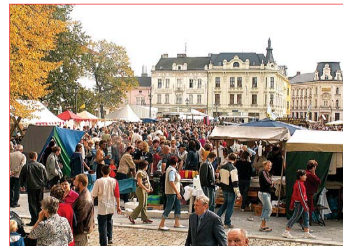
městského obvodu MOaP. Pak se na náměstí šermovalo, zpívalo, tančilo, prodávalo nejrůznější jarmareční zboží a děti obdivovaly i domácí zvířátka. Byl tam též mistr kat, kterého se nemusel nikdo bát.