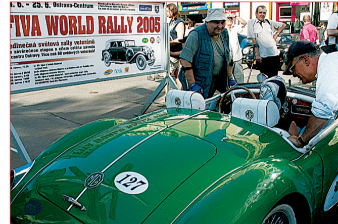
Fiva World Rally 2005, 24. a 25. června (foto 6, 7): mezinárodní závod automobilových veteránů, jehož jedna etapa končila a další měla start a dojezd právě v Ostravě. Před hotelem Imperial a na Jiráskově nám. se naskytl možnost zblížit