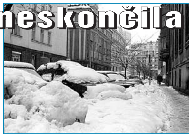
la závada ve schůdnosti na přilehlém chodní- ku, která vznikla znečištěním, následím nebo sněhem, pokud neprokáže, že nebylo v mezích jeho možnosti tuto závadu odstranit, u závady způsobené povětrnostními situacemi a jejich důsledky takovou závadu zmírnit.“

a tím patrně není u konce letošní sněhová ná- dílka. Zasněžené chodníky, silnice, veřejná prostranství jsou starostí těch, co je musejí udržovat ve schůdném a průjezdném stavu. Páte se, kdo odpovídá za údržbu komunikací v na- šem městském obvodu? Jsou to: 1. Technické služby Moravská Ostrava a Přívoz (tel. č. 596 622 922, www.okas.cz) a 2. Ostravské komunikace (tel. č. dispečinku 596 622 922, www.okas.cz) a 3. majitelé objektů . Je dobré vědět, jak je údržba komunikací roz- dělena. Technické služby MOaP zabezpečují průjezdnost komunikací, kde nejedí městská hromadná doprava (autobusy, trolejbusy a tramvaje), dále průchodnost parků, náměstí a jiných veřejných prostranství. Ostravské kom- unikace se zase starají o „páteřní“ silnice, te- dy ty, kde jezdí vozidla hromadné dopravy. Majitelům objektů pak zůstává starost o chodník přilehlý k jejich nemovitosti. Nemě- li by zapomínat, že zákon č. 13/1997 Sb., o po- zemních komunikacích, v paragrafu 27 uvádí: „Vlastník nemovitosti, která v zastavěném úze- mí obce hraničí se silnicí nebo s místní komu- nikací, odpovídá za škody, jejichž příčinou by-