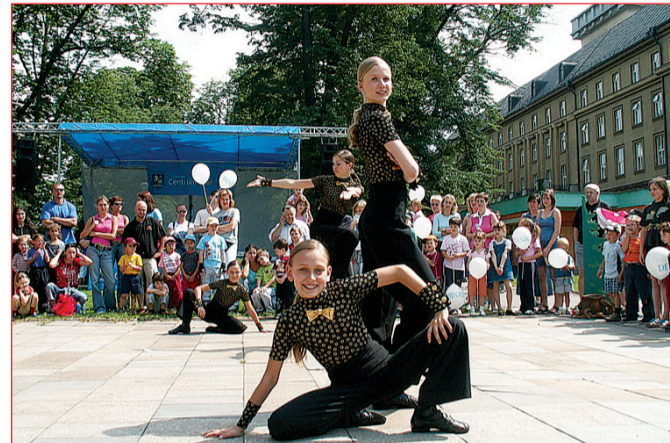
Centrum žije létem, 19. června (foto 5): v Komenského sadech vystoupily taneční soubory, čaroval kouzelník a na nafukovací lezecké stěně a jiných atrakcích děti dokazovaly neobojnost. Závod na kolečkových bruslích zvládli i „dospěláci“.