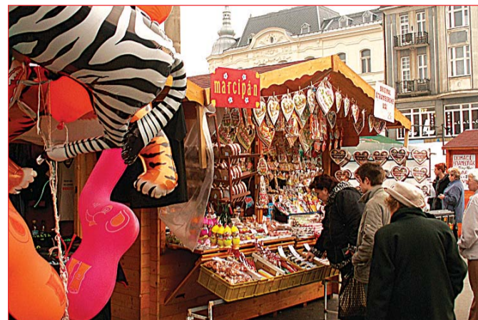
Slavnosti jara, od 4. do 28. března (foto 2): vnesly do centra Ostravy kouzlo jara, třebaže jim z počátku počasí nepřálo. K slavnostem patřila nabídka zboží ve stylových stáncích na Masarykově náměstí a také tři desítky vystoupení.