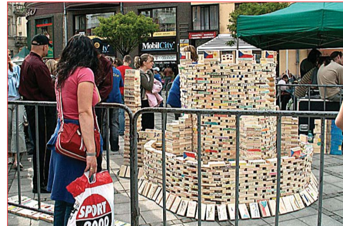
louce program nabídl řadu atrakcí především mládeži. Uskutečnila se i jedinečná stavba hradu na Jiráskově náměstí. Byl zhotoven ze 4000 pomalovaných, dřevěných cihlíček. S radostí je zdobily děti i dospělí.