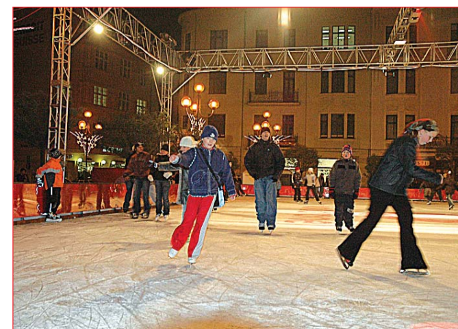
Kluziště Vodafone, od 2. 12. 2005 do 1. 1. 2006 (foto 15): umělá ledová plocha na Jiráskově nám. byla jednou z největších atrakcí, kterou projekt Centrum žije nabídl Ostravanům. Využily ji tisíce bruslařů nejrůznějšího věku.