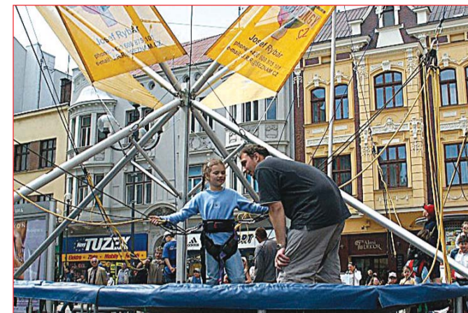
Ostrava si hraje, 14. května (foto 3, 4): program zahrnující nejrůznější soutěže, dále např. show motorkářů či rekonstrukci historické bitvy o slezskoostravský hrad, též vystoupení mažorettek, skupin Kuličky štěstí a Javory. Na Černé