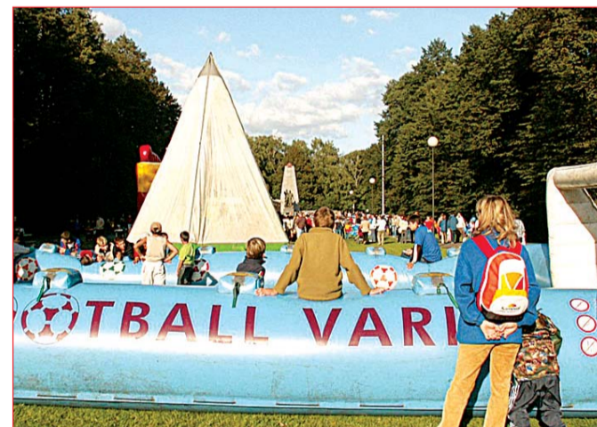
Rozloučení s létem, 18. září (foto 10): zábavný program v Komenského sadech, které se staly rájem dětí. Ty nadšeně tleskaly populárnímu herci M. Nesvadbovi a nejen jemu. Vydováděly se na nafukovacím fotbalovém hřišti a jiných atrakcích.