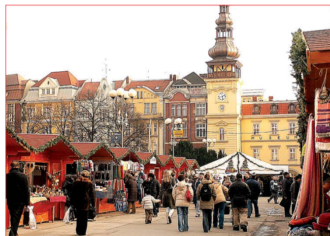
Vánoční trhy 2005, od 29. 11. do 23. 12. (foto 14): v dřevěném městečku postaveném na Masarykově nám. se daly koupit sladkosti, vánoční ozdoby, stromky aj. Byla tu i možnost zastavit se a podívat na vystoupení zpěváků a různých skupin.