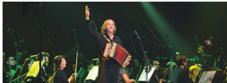
Jarek Nohavica při prvním koncertu s JFO v Gongu v roce 2012.