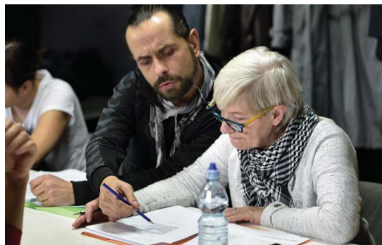
Herci Komorní scény Aréna při zkouškách textu titulu Tři sestry.