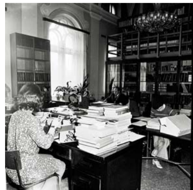
Snímky z roku 1975.