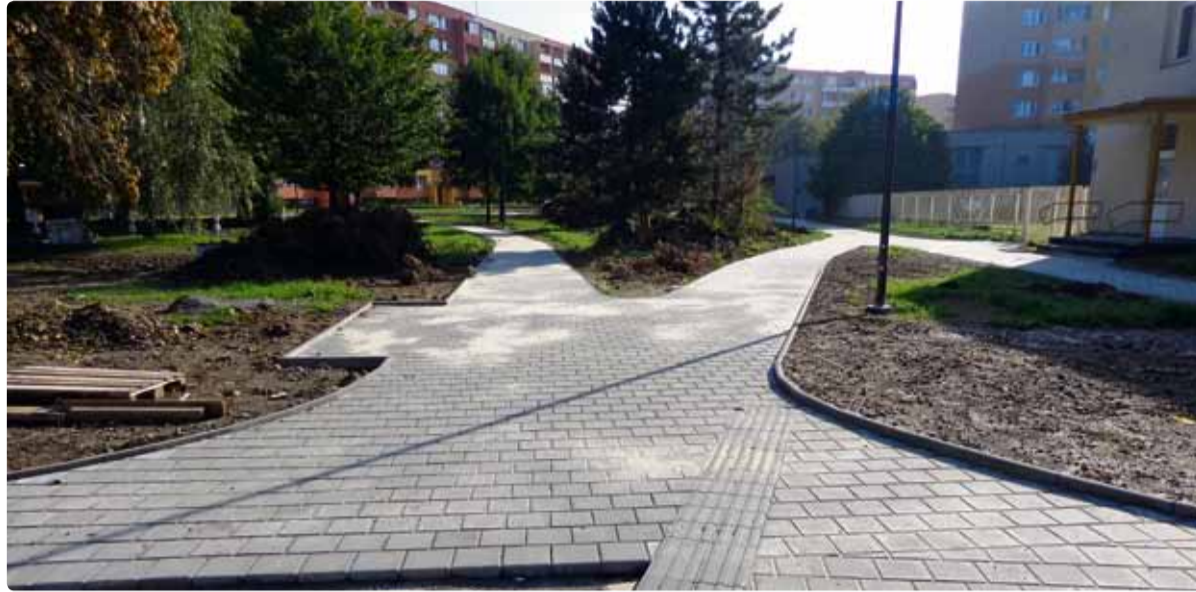
Regenerace sídliště Fifejdy II - II. etapa.