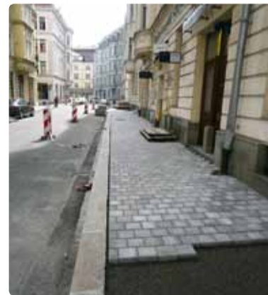
Oprava chodníků v ulici S. K. Neumanna.

ci započala rekonstrukce chodníků v ulici S. K. Neumanna, která by měla být ukončena v polovině září. Tady bude nevyhovující asfaltový povrch ve špatném technickém stavu vyměněn za zámkovou dlažbu a proběhnou i další potřebné změny. Souběžně s touto stavbou provede společenství vlastníků domu S. K. Neumanna 4 izolaci zdva budovy. V průběhu září pak bude na sídlišti Fifejdy, v lokalitě č. 5, ukončena právě probíhající oprava chodníků v ulici Josefa Brabce a dokončena stavba nového parkoviště. „Zmíněné akce jsou zaměřeny nejen na zkvalitnění prostředí, ale jejich cílem je také zvýšení bezpečnosti chodců i řidičů,“ podotýká v souvislosti se zmíněnými akcemi místostarosta.