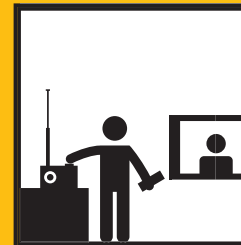
ZAPNĚTE SI ROZHLAS A TELEVIZI