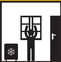
ZAVŘETE OKNA A DVEŘE A VYPNĚTE KLIMATIZACI