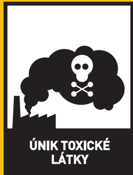
ÚNIK TOXICKÉ LÁTKY