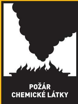
POŽÁR CHEMICKÉ LÁTKY