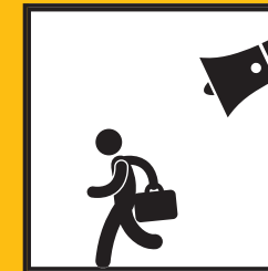
PŘI EVAKUACI DBEJTE POKYŇŮ ZASAHOJÍCÍCH SLOŽEK