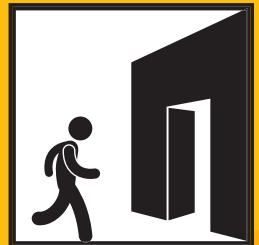
SCHOVEJTE SE, BUDOVA VÁS OCHRÁNÍ