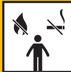
VYPNĚTE VŠECHNY ZDROJE INICIACE A NEKUŘTE