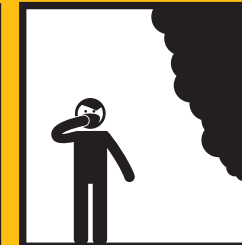
NOS A ÚSTA CHRÁŇTE NAVLHČENOU ROUŠKOU